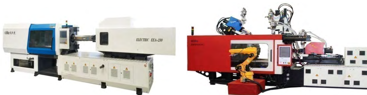
图3：公司的注塑机产品节选

自动供料系统是公司根据客户厂房环境、现场机台的摆放情况和现场原料用料情况，结合公司自产的各类特有注塑机、配套设备及直角坐标机器人，设计的一种能够实现全厂无人化不间断作业的生产车间整体解决方案。该系统采用工业电脑自动对所有机台进行集中控制，实现了对所有用料单元的24小时连续自动化供料作业，配合系统中各注塑机配套设备的不同功能，实现“原料→储存→计量→干燥→输送→成型→物流”全过程的自动化生产。