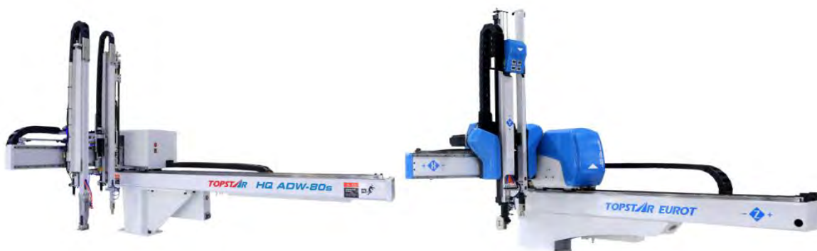
图2：XYZ三向伺服控制五轴机械手

2) 直角坐标机器人产品描述： 直角坐标机器人又称为机械手，它能够实现自动控制的、可重复编程的、运动自由度间成空间直角关系的、多用途的操作机。公司自主研发、生产的直角坐标机器人采用伺服马达驱动，使用皮带、齿轮、齿条进行传动，并配备高精密线性滑轨以导向运行，使产品具有定位精准、运动速度快、运行稳定等特点，可应用于直线、平面、立体的工件搬运移栽、检测定位、自动装配等工序。